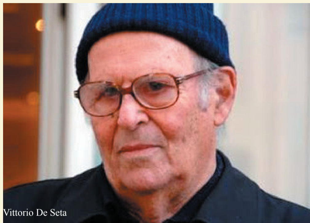
Vittorio De Seta

E' morto in Calabria all'età di 88 anni il regista Vittorio De Seta. Il decesso è avvenuto ieri sera alle 22. De Seta, nato a Palermo nel 1923, negli anni Cinquanta realizzò documentari su Sicilia e Sardegna. Nel '61 diresse il film ‘Banditi a Orgosolo’.